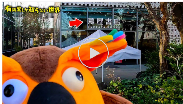
動画【手加減しない】突撃！ 蔦屋書店