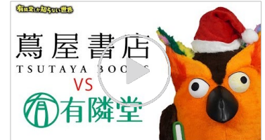
動画【逸品vs逸品】クリスマスプレゼント対決