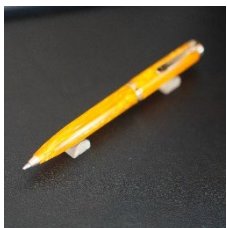
「スーベレーン K 600」