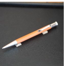
「カステルギロシェ」