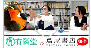
動画【友達にあげるなら】 クリスマスプレゼント対決 後編