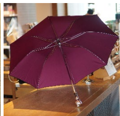
「テレスコピック アニマルヘッド」