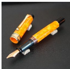
「オプティマ アランチョ」