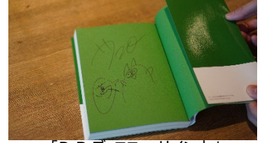
「R.B.ブッコロー サイン本」

https://store.tsite.jp/daikanyama/floor/shop/tsutaya-books/