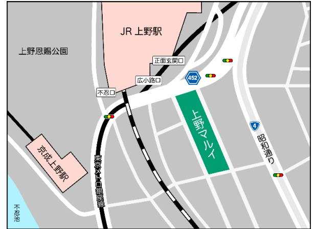
「STORY STORY UENO」周辺地図