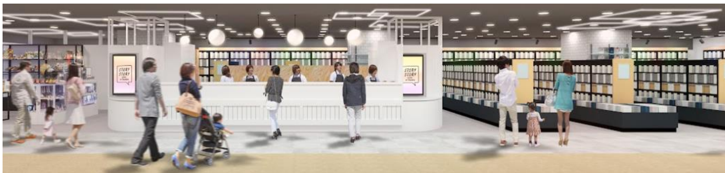
「STORY STORY UENO (ストーリー ストーリー ウエノ)」店頭イメージ