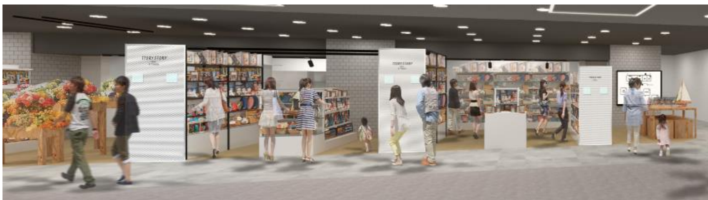
「STORY STORY UENO (ストーリー ストーリー ウエノ)」ワークショップイメージ