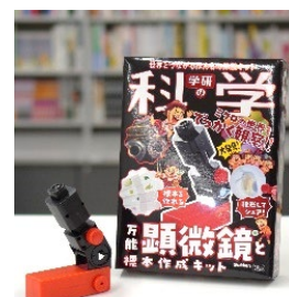
「万能顕微鏡と 標本作成キット」