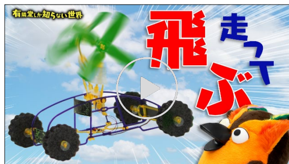
動画【夏休みの宿題はコレ!】自由研究キットの世界2023