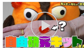
動画【夏休みの宿題…楽々クリア!】 自由研究キットの世界