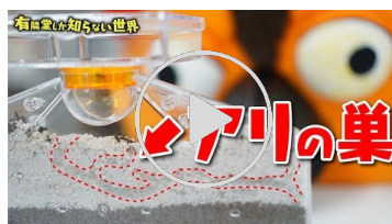
動画【夏休み企画!】 自由研究キットの世界2022