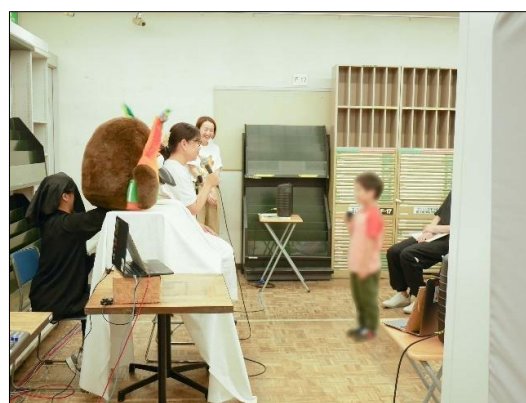
トークイベントの様子