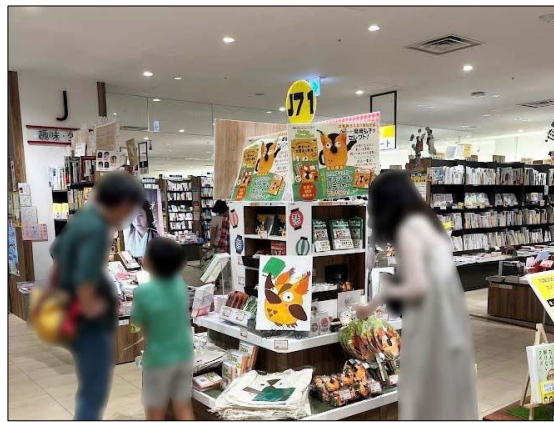
三省堂書店 名古屋本店店内のブックローグズコーナー