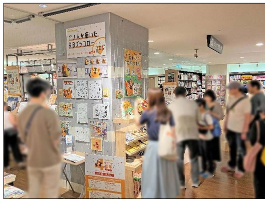
R.B.ブッコローのイラストパネル展の様子