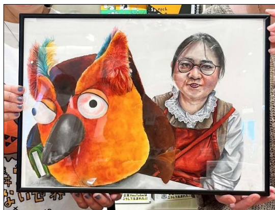
お客様が描いたイラスト