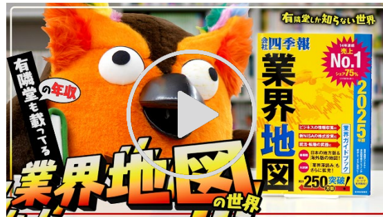
動画【累計 25 万部超】業界地図の世界