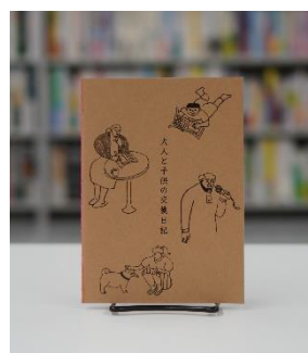
大人と子供の交換日記