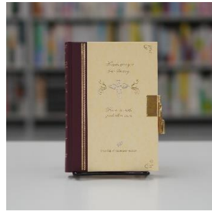
日記 鍵付 天使柄