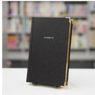
日記 5年連用 プレミアム