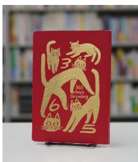
エディターズシリーズ 365 デイズノート