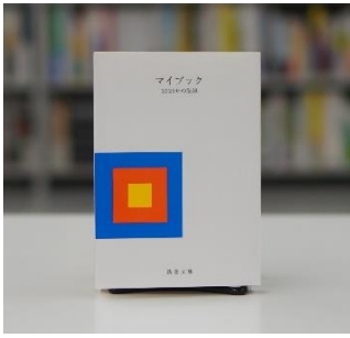
マイブック -2025年の記録-