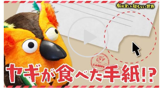
動画【大切な手紙に】便箋の世界