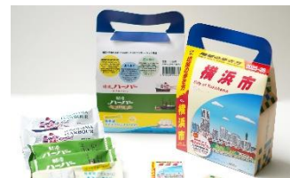
特製コラボパッケージ「ありあけのハーバー」