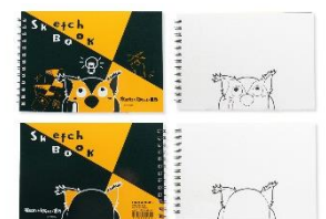
R.B.ブッコロー 図案スケッチブック B6