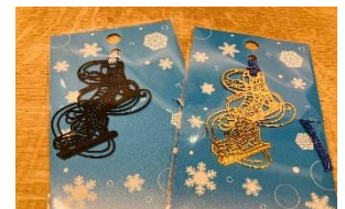
アトレ恵比寿店限定 オリジナルグッズ「スケートしおり」