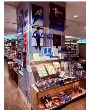
アトレ恵比寿店 羽生結弦氏の 写真集関連商品コーナー (2024年12月時点)