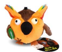
R.B.ブッコロー キーチェーン付きぬいぐるみ<通常版>