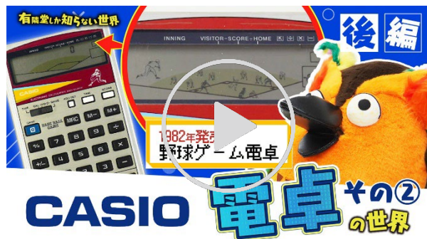
動画【昭和の名機⑫選&amp;最新機種】電卓の世界 その② 後編

前後編を通じて、国内電卓売上シェア No.1 を誇るカシオ計算機の担当者である齊藤氏の専門的な解説を交えながら、以下のポイントを掘り下げています。