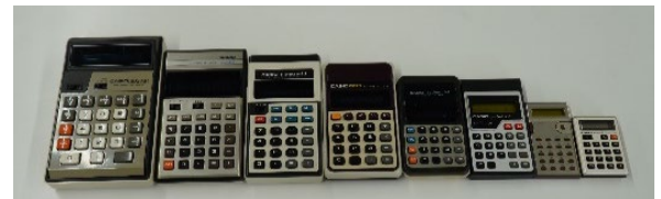
左から) 803-MR/H-2/memory-10/MEMORY-81/ pocket-mini/pocket-LC/LC81/micro-mini