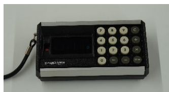
CM-601 CASIO MINI