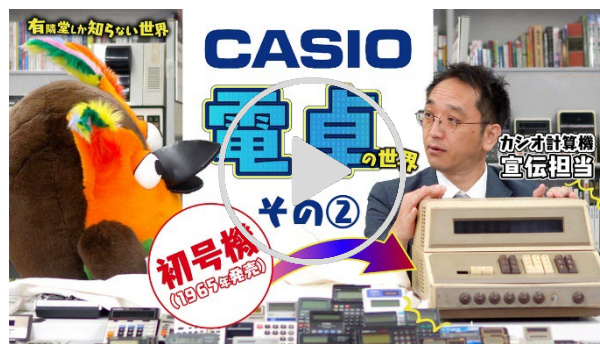
動画【“超”小さくなっていく】電卓の世界 その② 前編