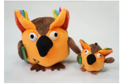
左「R.B.ブッコロー ぬいぐるみ 16 cmぬいぐるみ」 右「R.B.ブッコローキーチェーン付きぬいぐるみ」

チャンネルから生まれたオリジナルグッズは現在までで 12 アイテム。キーチェーン付きぬいぐるみや、ジェットストリーム（ボールペン）等の定番グッズ以外に、知育玩具「LaQ R.B.ブッコロー」や、シーリングスタンプなど、チャンネルの企画から生まれた商品もございます。YouTube チャンネル発の有隣堂でしか買えないオリジナルグッズで、リアル店舗や EC との連動展開を強化しています。